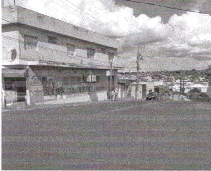
Vista do local.