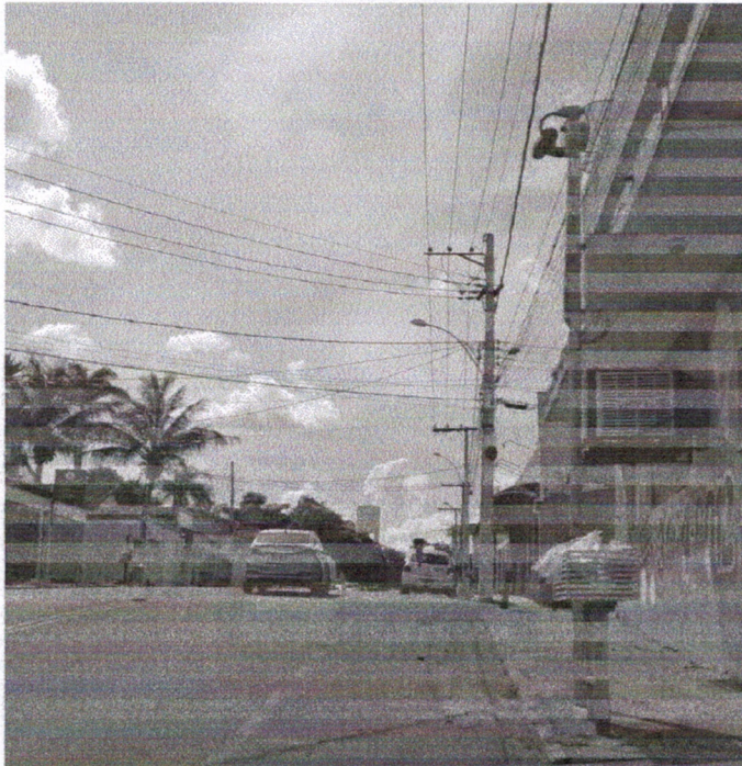
Vista do local.