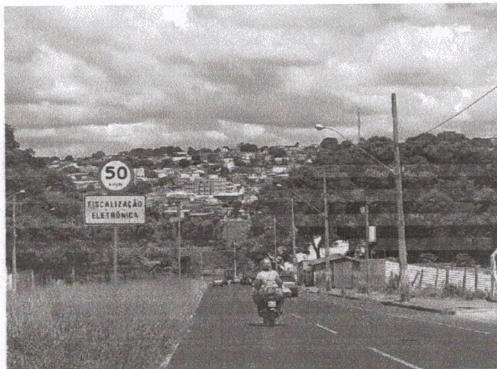
Vista do local.