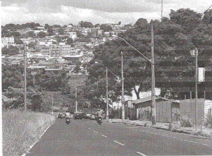
Vista do local.