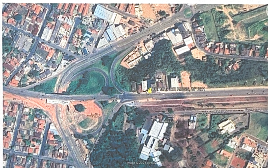
Vista Superior