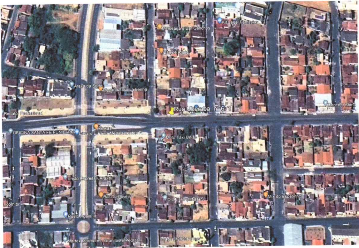
Vista Superior