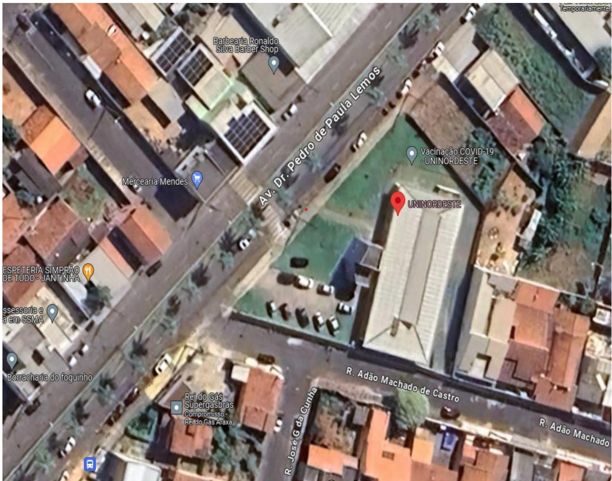
Imagem de Satélite - Localização da Unidade de Saúde UNINORDESTE - Araxá- MG

NOME DO PROJETO: REFORMA UNINORDESTE ENDEREÇO: AV. DR PEDRO DE PAULA LEMOS Nº 1110 - ANA ANTÔNIA - ARAXÁ - MG COORDENADAS: 19°34'27''S; 46°55'41W ÁREA EDIFICAÇÃO: 582,74 m² Nº DE PAVIMENTOS: 01 (um)