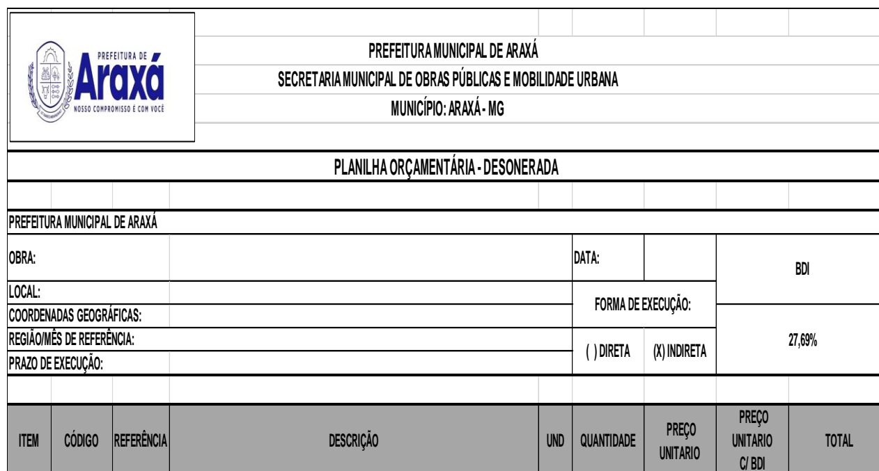
Figura 1: Modelo de cabeçalho da planilha orçamentária

Quando for necessário realizar cotação a mercado, está deverá ser cotada com pelo menos 3 empresas idôneas, e assim retirado o preço médio dos orçamentos para compor um item da planilha orçamentária.