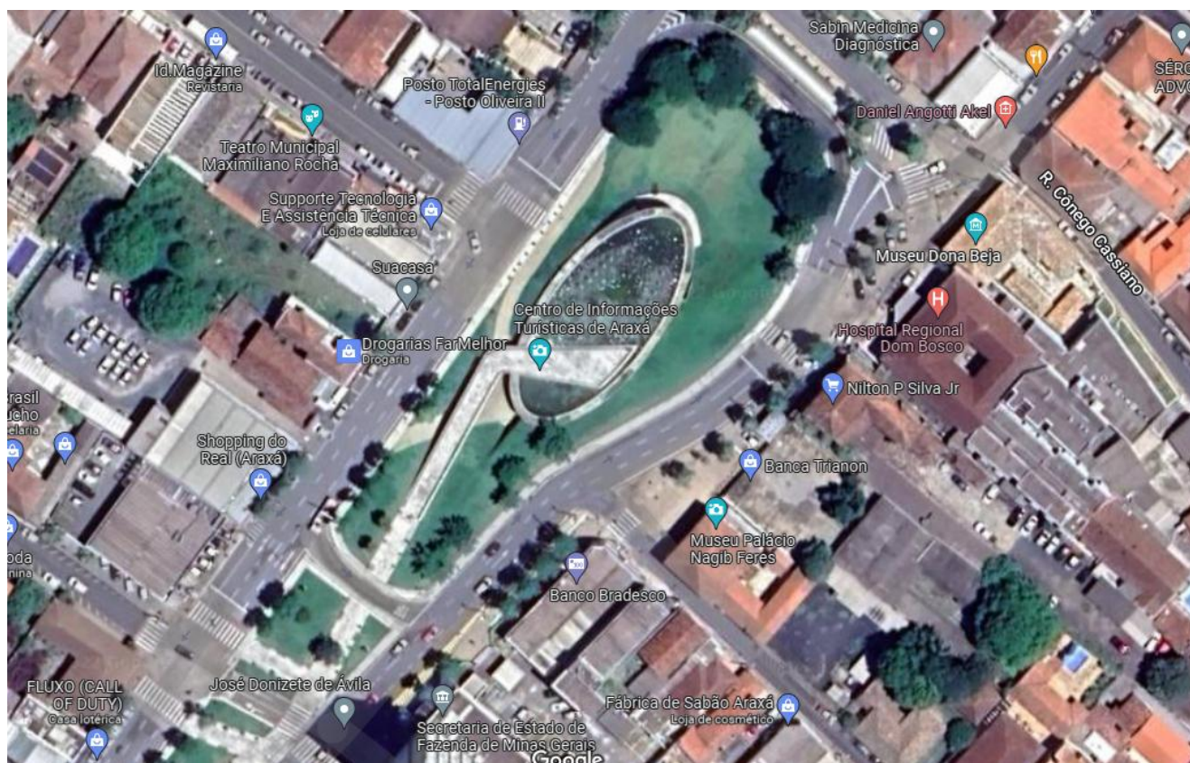
Imagem de Satélite - Localização Teatro Municipal - Araxá- MG

NOME DO PROJETO: CONSTRUÇÃO BANHEIRO PÚBLICO EXTERNO TEATRO MUNICIPAL ENDEREÇO: AVENIDA ANTÔNIO CARLOS S/N COORDENADAS GEOGRÁFICAS: 19°35'23.3"S // 46°56'17.4"W ÁREA EDIFICAÇÃO: 78,46 m 2 Nº DE PAVIMENTOS: 01(UM)