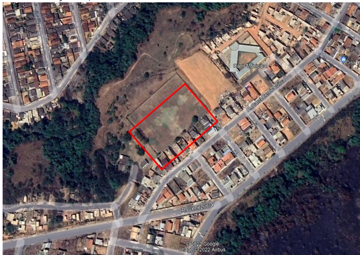
Imagem de Satélite - Localização CAMPO DO FERROCARIL - Araxá- MG.