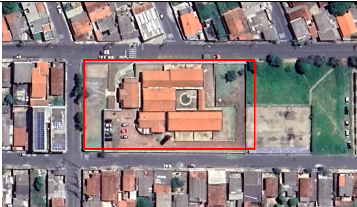
Imagem de Satélite - Localização da Cemei Armindo Barbosa - Araxá- MG

NOME DO PROJETO: REFORMA CEMEI - ARMINDO BARBOSA ENDEREÇO: AV: SEBASTIÃO FERREIRA PINTO / N° 743 - ANA PINTO DE ALMEIDA - ARAXÁ - MG COORDENADAS: 19°34'08.32" S / 46°56'35.18" O ÁREA EDIFICAÇÃO: 4400 M2 N° DE PAVIMENTOS: 01 (UM)