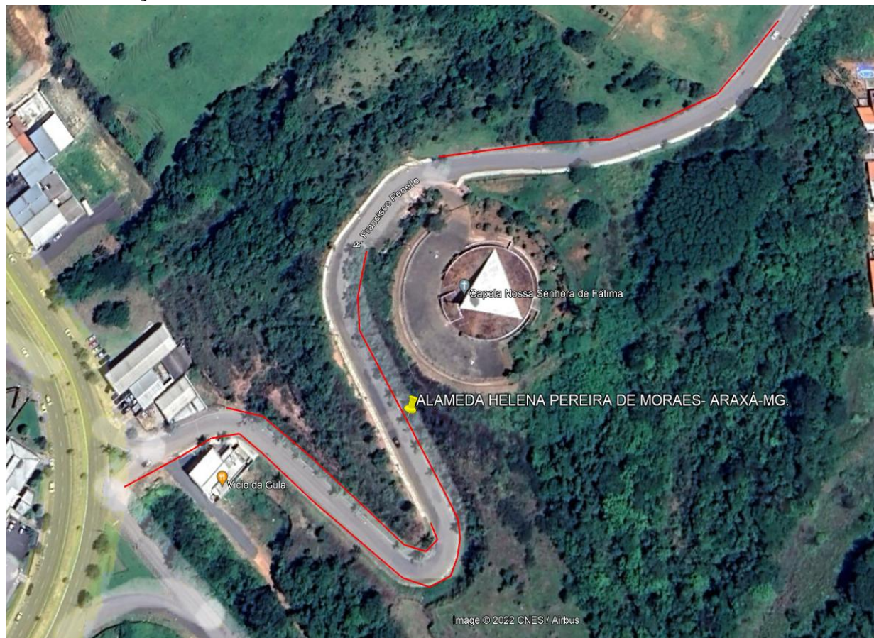
IMAGEM DE SATÉLITE - LOCALIZAÇÃO DA PRAÇA - ARAXÁ- MG

NOME DO PROJETO: EXECUÇÃO DE ACESSIBILIDADE NA ALAMEDA HELENA PEREIRA DE MORAES. ENDEREÇO: ALAMEDA HELENA PEREIRA DE MORAES- ARAXÁ-MG. ÁREA EDIFICAÇÃO: 1600 M2