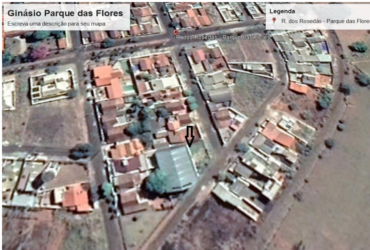
Imagem de Satélite - Localização Ginásio esportivo Parque das Flores - Araxá- MG

NOME DO PROJETO: REFORMA DO PISO SO GINÁSIO POLIESPORTIVO JOSÉ CUSTÓDIO DE REZENDE NO PARQUE DAS FLORES ARAXÁ/MG ENDEREÇO: RUA DAS ROSEDAS COM RUA DOS HIBISCOS - PARQUE DAS FLORES Nº DE PAVIMENTOS: 1 (um)