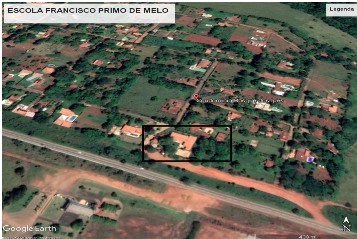
Imagem de Satélite - Localização Escola Francisco Primo de Melo - Araxá- MG

NOME DO PROJETO: REFORMA E RECUPERAÇÃO DA ESCOLA MUNICIPAL FRANCISCO PRIMO DE MELO. ENDEREÇO: BR 452, KM 05, BOSQUE DOS IPÊS, NA ZONA RURAL, NO MUNICÍPIO DE ARAXÁ MG N° DE PAVIMENTOS: 1(UM)