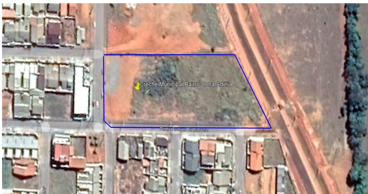
Imagem de Satélite - Localização da obra de construção CRECHE - Araxá/MG

NOME DO PROJETO: IMPLANTAÇÃO DE CRECHE NO BAIRRO DONA ADÉLIA ENDEREÇO: RUA PEDRO AVELINO DE CARDOSO S/N DONA ADÉLIA ÁREA A SER CONSTRUÍDA: 2.614,79 m 2 Nº DE PAVIMENTOS: 01(UM)