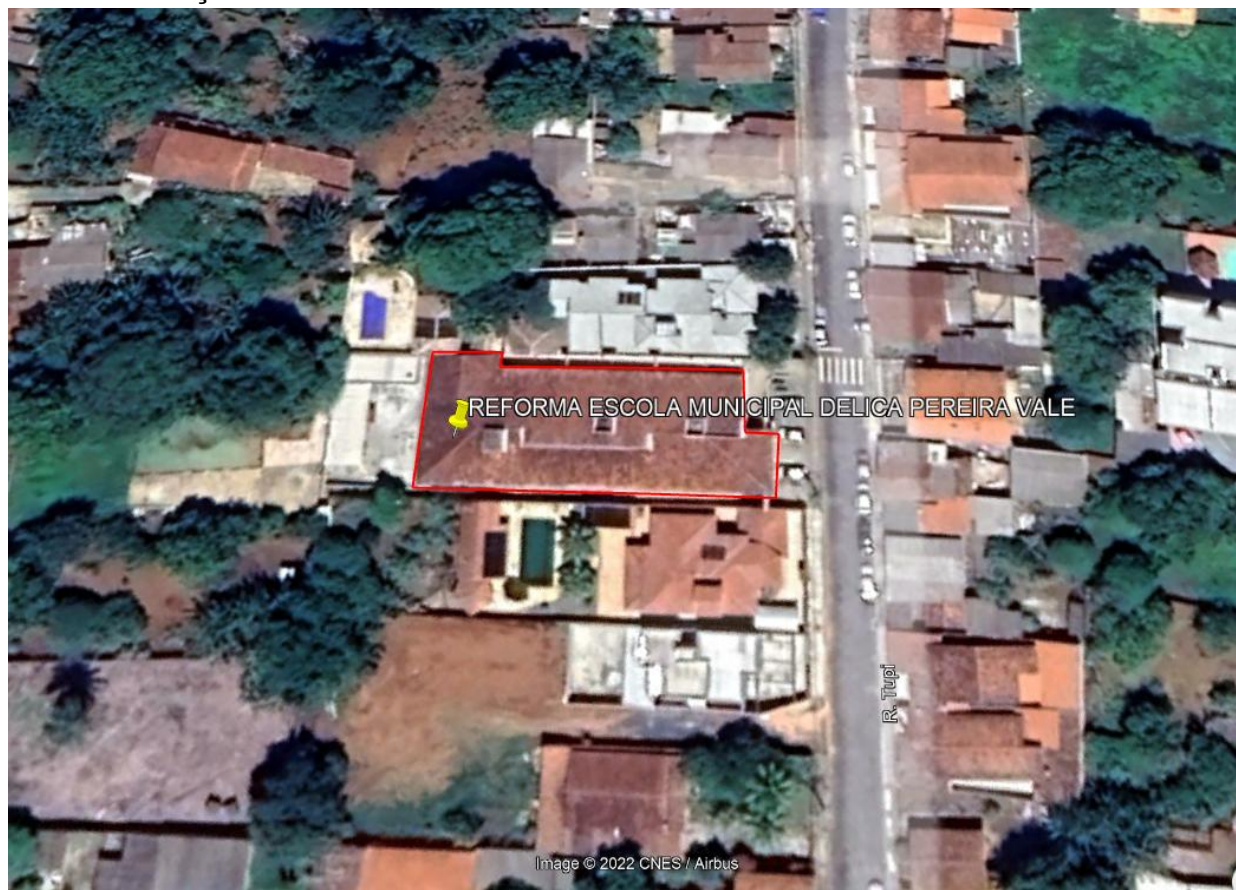
Imagem de Satélite - Localização Escola Municipal Delica Pereira Vale - Araxá- MG

NOME DO PROJETO: REFORMA DA COBERTURA DO PREDIO DO CEMEI DELICA PEREIRA VALE ENDEREÇO: RUA TUPI, N° 178 - SANTO ANTONIO - ARAXÁ MG N° DE PAVIMENTOS: 1(um) ÁREA EDIFICAÇÃO: 900 M2