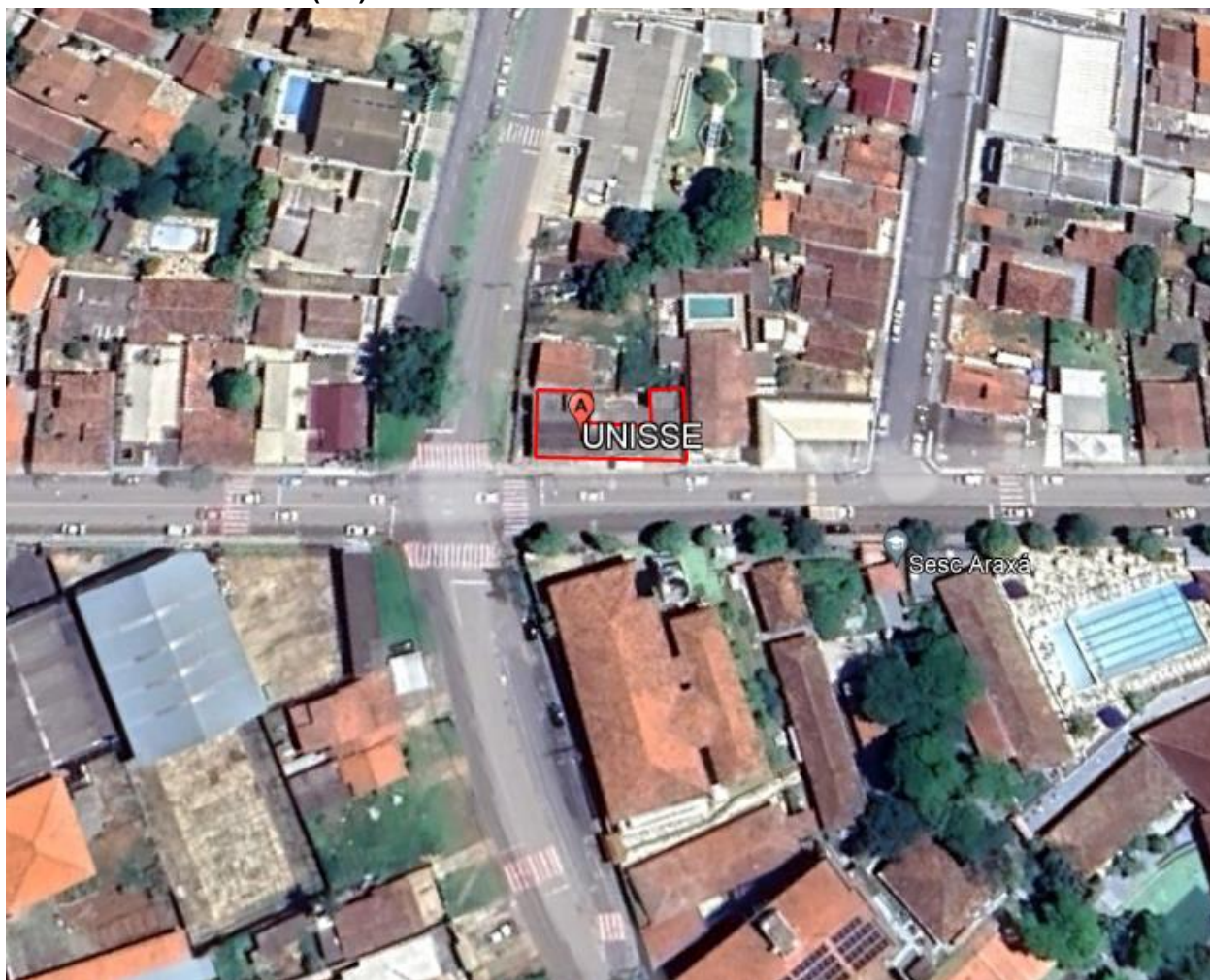
Imagem de Satélite - Localização da Unidade de Saúde UNISSE - Araxá- MG

NOME DO PROJETO: REFORMA UNISSE ENDEREÇO: RUA: DR. EDMAR CUNHA/ N° 135 - VILA SANTA TEREZINHA - ARAXÁ - MG COORDENADAS: 19°36' 19.09"S / 46°56'18.29"O ÁREA EDIFICAÇÃO: 265 M2 N° DE PAVIMENTOS: 01 (um)