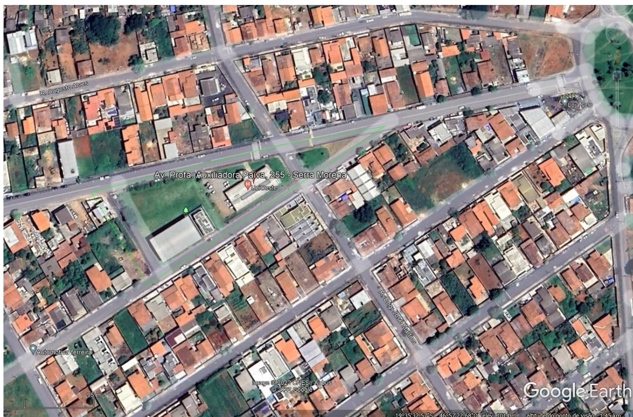
Imagem de Satélite - Localização da Unidade de Saúde UNIOESTE - Araxá- MG

NOME DO PROJETO: REFORMA UNIOESTE ENDEREÇO: AV. PROFA. AUXILIADORA PAIVA, 255 - SERRA MORENA, ARAXÁ - MG COORDENADAS: 19°35'33.39"S / 46°57'32.30"O ÁREA EDIFICAÇÃO: 570,70 m 2 Nº DE PAVIMENTOS: 01 (um)