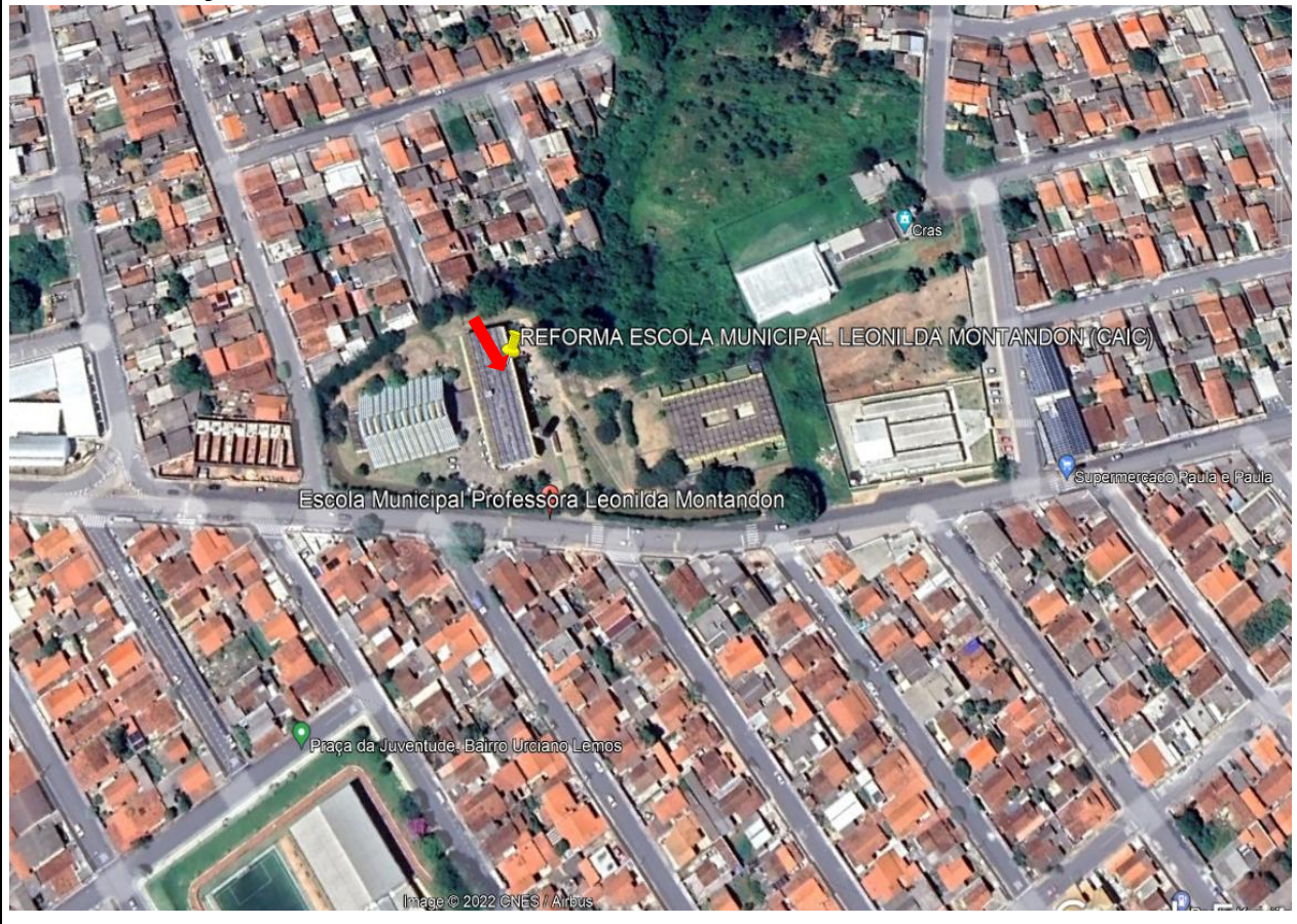
Imagem de Satélite - Localização Escola Municipal Leonilda Montadon (CAIC) - Araxá- MG

NOME DO PROJETO: REVITALIZAÇÃO E REFORMA ESCOLA MUNICIPAL LEONILDA MONTANDON (CAIC) ENDEREÇO: AVENIDA JOSÉ SEVERINO DE AGUIAR, 155 URCIANO LEMOS/ ARAXÁ/MG COORDENADAS GEOGRÁFICAS: 19 34' 29.48" S - 46 56' 23.40" O ÁREA EDIFICAÇÃO: 3 000 M2