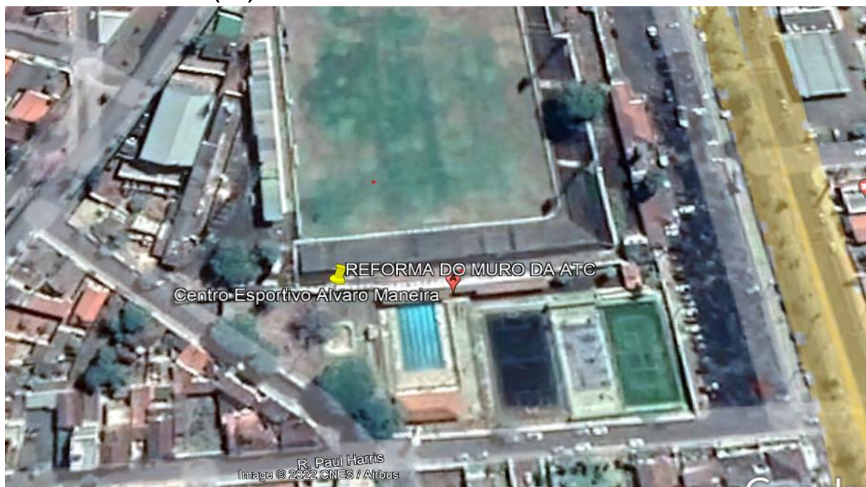
Imagem de Satélite - Localização casa da ATC - Araxá- MG

NOME DO PROJETO: REFORMA DO MURO DA CASA DA ATC ENDEREÇO: R. PAUL HARRIS, 40 VILA JOAO RIBEIRO, ARAXÁ Nº DE PAVIMENTOS: 1 (um)