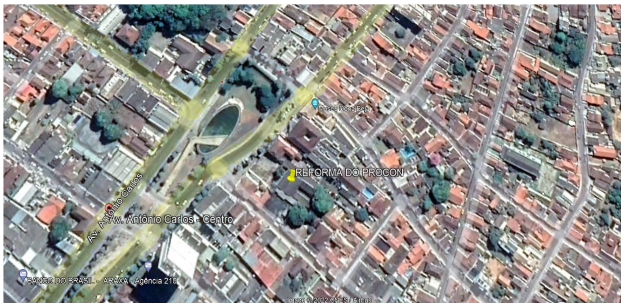
Imagem de Satélite - Localização Procon - Araxá- MG