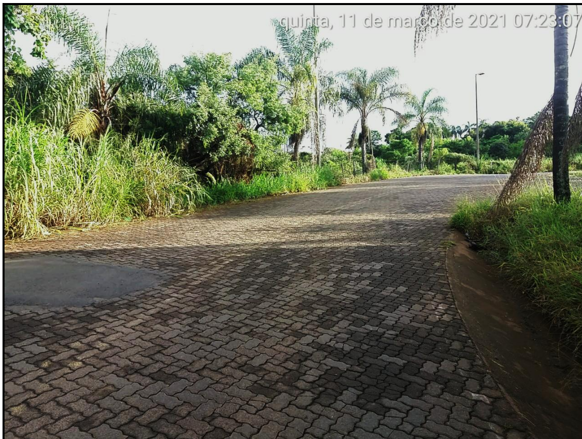
Figura 1 - Alameda Helena P. de Moraes