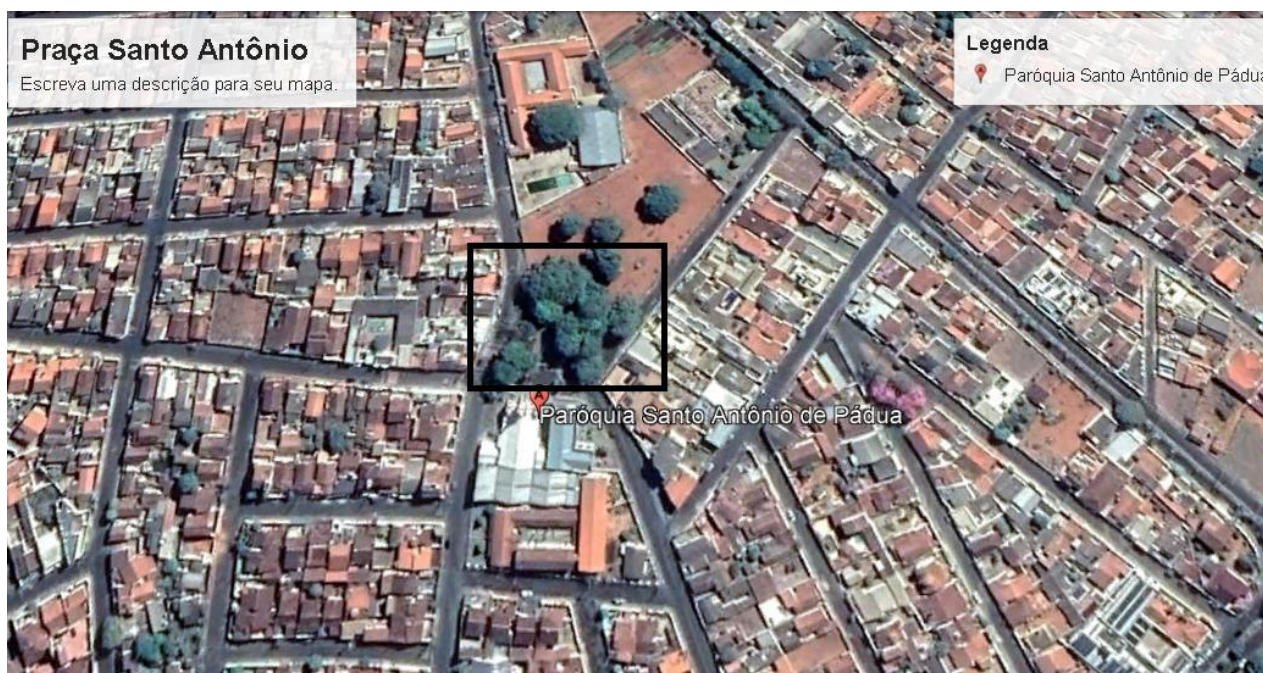
Imagem de Satélite - Localização praça Santo Antônio - Araxá- MG

NOME DO PROJETO: REFORMA E REVITALIZAÇÃO DA PRAÇA PADRE ANACLETO NO SANTO ANTÔNIO - ARAXÁ/MG ENDEREÇO: RUA SANTO ANTÔNIO - ARAXÁ/MG ÁREA EDIFICAÇÃO: 350 M2