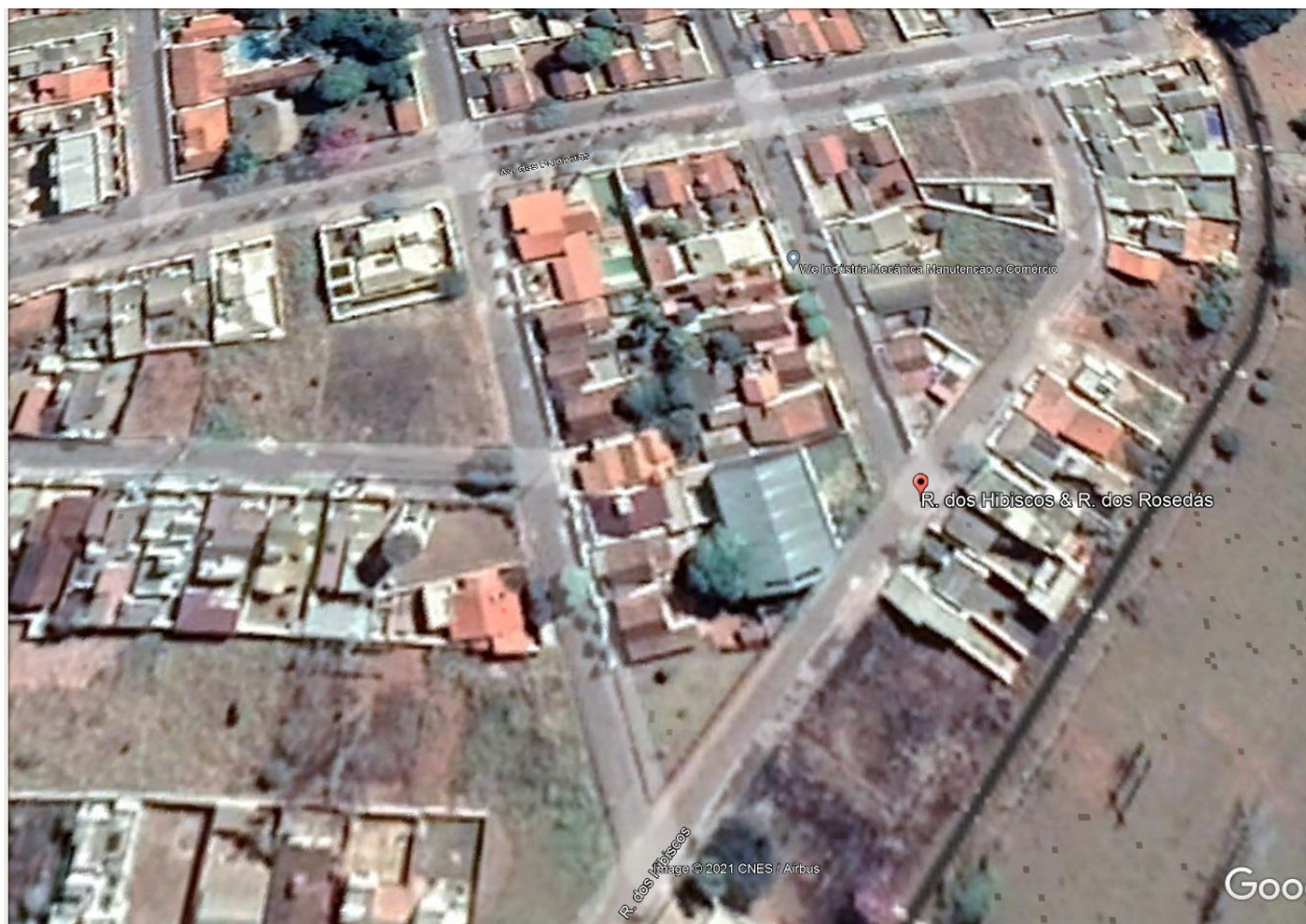
Imagem de Satélite - Localização Ginásio esportivo Parque das Flores - Araxá- MG

NOME DO PROJETO: REFORMA GINÁSIO ESPORTIVO PARQUE DAS FLORES ENDEREÇO: RUA DAS ROSEDAS COM RUA DOS IBISCOS - PARQUE DAS FLORES Nº DE PAVIMENTOS: 1 (UM)