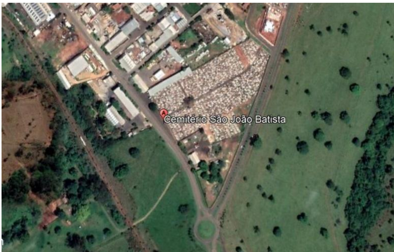
Imagem de Satélite - Localização Cemitério São João Batista - Araxá- MG