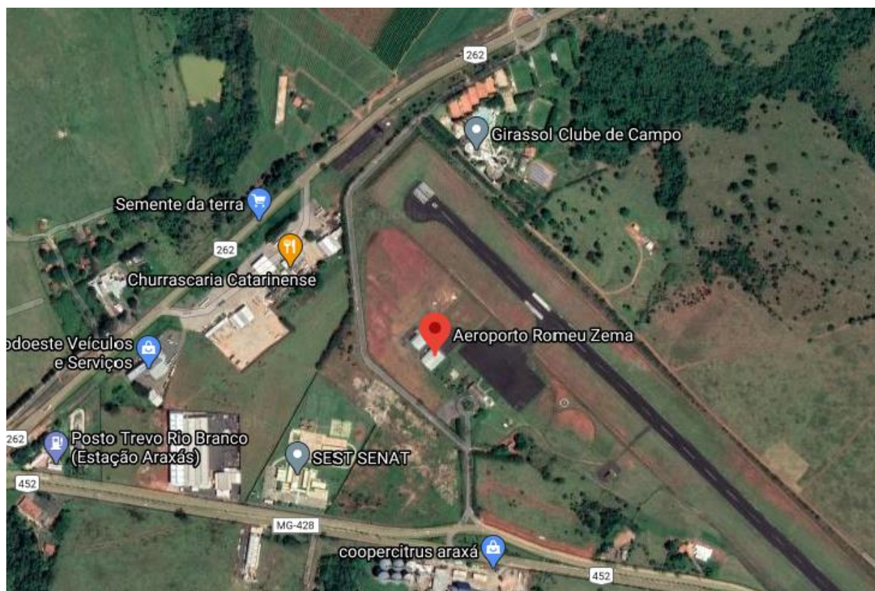
Imagem de Satélite - Localização Aeroporto Romeu Zema - Araxá- MG

NOME DO PROJETO: REFORMA COBERTURA DO AEROPORTO ROMEU ZEMA ENDEREÇO: Av. Min. Olavo Drummond, 2100 - São Geraldo, Araxá - MG, 38180-400 ÁREA EDIFICAÇÃO: Nº DE PAVIMENTOS: 1 (um)