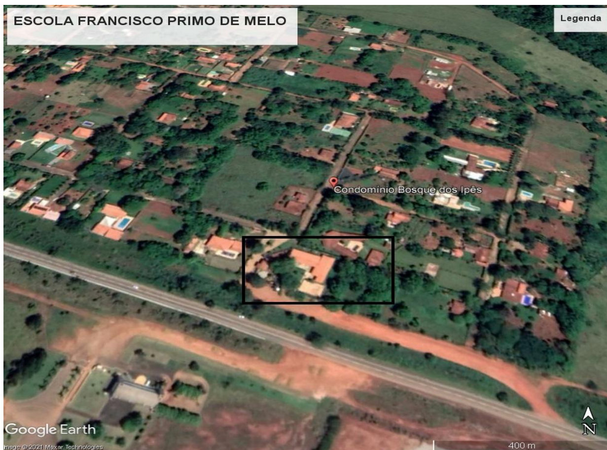
Imagem de Satélite - Localização Escola Francisco Primo de Melo - Araxá- MG

NOME DO PROJETO: REFORMA E RECUPERAÇÃO ESCOLA FRANCISCO PRIMO DE MELO ENDEREÇO: BR 452, KM 05 - Bosque dos Ipês Nº DE PAVIMENTOS: 1 (um)