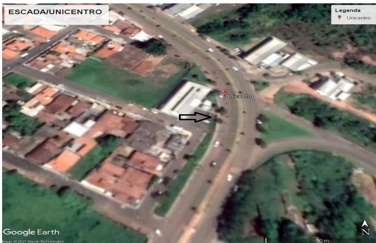
Imagem de Satélite - UNICENTRO - Araxá- MG

NOME DO PROJETO: EXECUÇÃO DE ESCADA NO UNICENTRO ENDEREÇO: Av. Damaso Drummond, 275 - Vila São Pedro- Unicentro ÁREA EDIFICAÇÃO: 15m 2